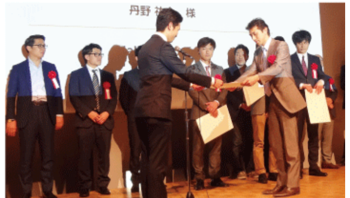
プレゼンイベントで本選出場者 4 社を選んだ = 6 日、東京

リソースは 6 日、海外進出を支援する日本企業のプレゼン大会「出島甲子園」の予選を東京で開催。4 社が秋に開催する本選出場を決めている。